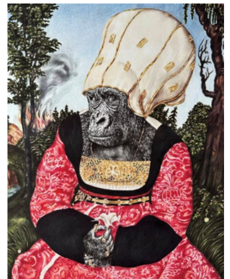
BILDER VON SUSANNE VOWINCKEL