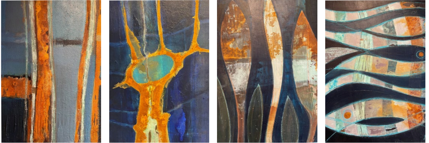
BILDER VON ELLEN SCHULER

Am Samstag, 21. Februar 2026 findet von 15– 17 Uhr in unseren Räumen wieder eine Vernissage mit Werken zweier unterschiedlicher Künstlerinnen statt. Wir laden Sie zum Auftakt dieser Ausstellung, die noch bis Mai dauern wird, herzlich ein und freuen uns auf Ihren Besuch.