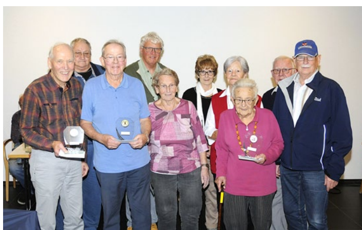
DIE «TOP TEN» MIT DREI STRAHLENDE POKALGEWINNER/INNEN