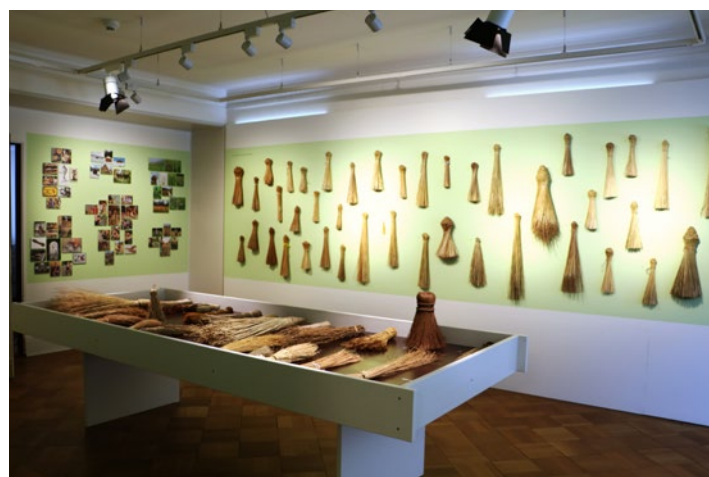
EINE ZEITREISE IN DAS SPANNENDE STROHMUSEUM WOHLLEN

Raus aus dem Alltag, rein ins Abenteuer. Mit Unterstützung des Zivilschutzes und den Aktivierungs-Mitarbeiterinnen und natürlich den begeisterten Teilnehmenden.