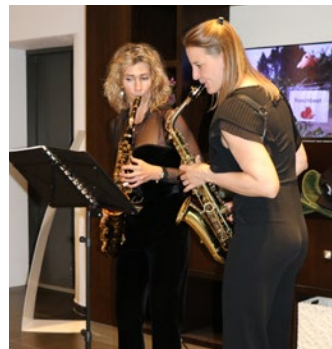
DAS VIRTUOSE DUO STRAX