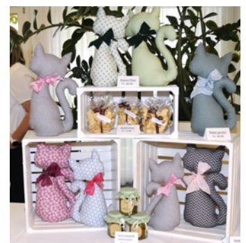
KREATIVES AUS DER AKTIVIERUNG