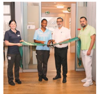
ERÖFFNUNG HAUS C

Im Frühjahr konnten wir Sie mit dem Spatenstich zum Haus C über unsere bauliche Erweiterung informieren. 10 Monate später durften wir nun am 10. Dezember die Schlüssel zum gelungenen Werk in Empfang nehmen. Damit ist der erste Teil dieser Erweiterung abgeschlossen, und im Anschluss daran können nach dem erfolgten Umzug eines Teils der Administration und des Personal-Aufenthaltsraums die frei gewordenen Flächen für den Umbau der Küche sowie der dazugewonnenen Zimmer anstelle der Büros ausgeführt werden. Gerne werden wir nach Fertigstellung in der kommenden Seniorenpost darüber noch etwas ausführlicher berichten.